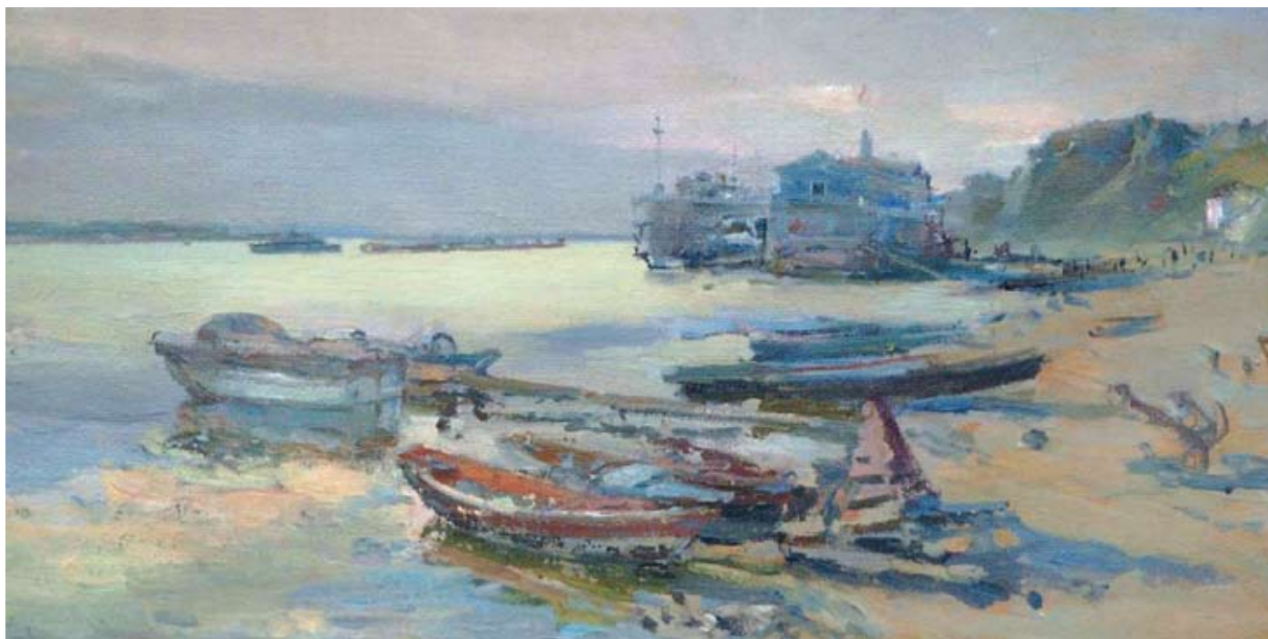
▲ Причал в Каневе. 1960. К., м. 49×80 см. Собрание семьи художника