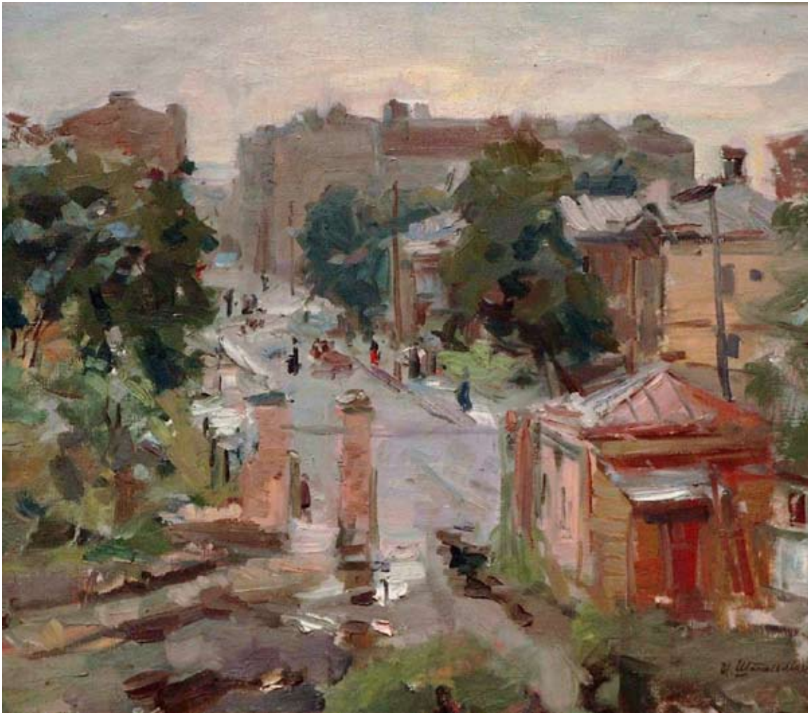
◀ Вид из окна Художественного института. 1946. Х., м. 63×74 см. НХМУ