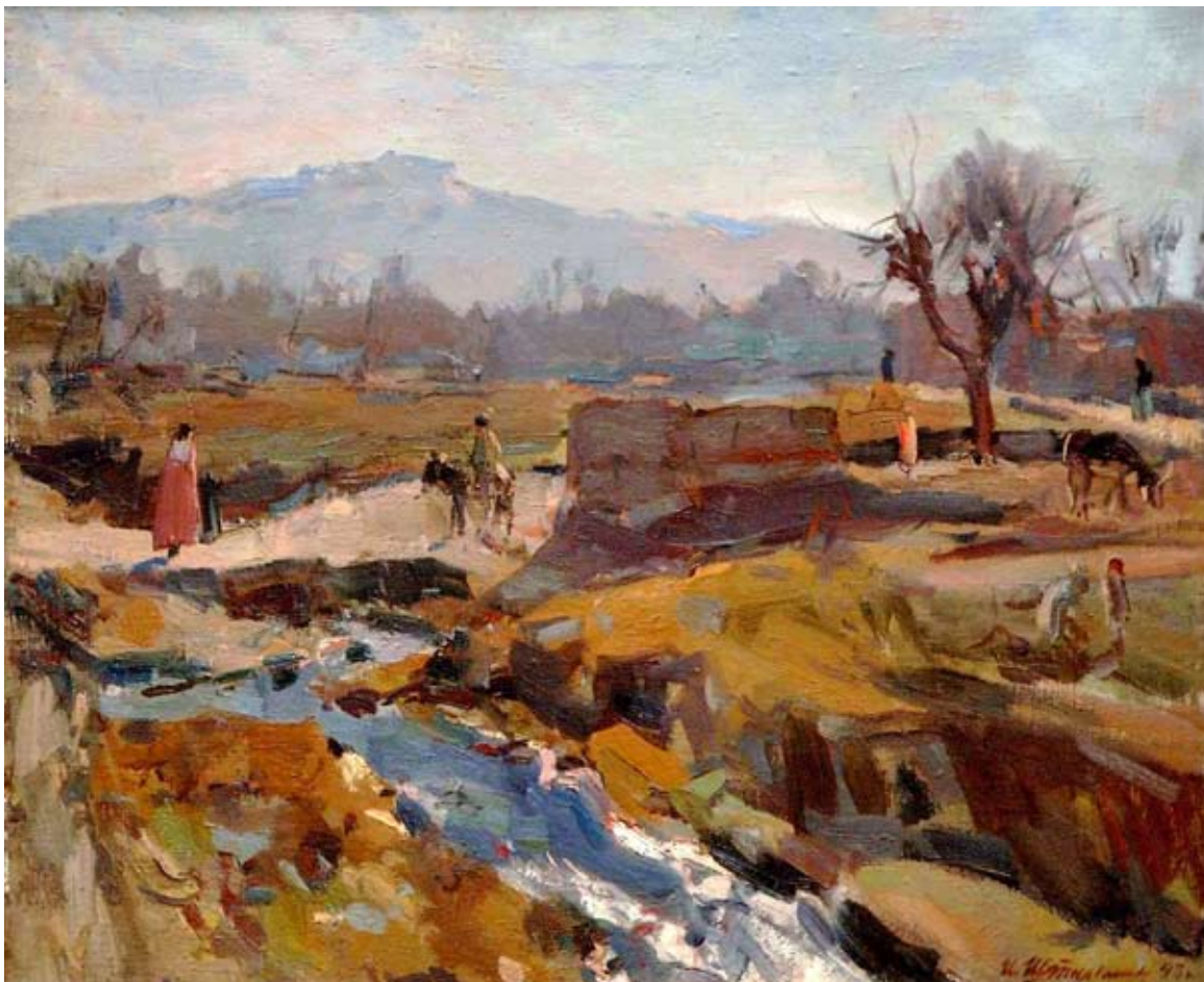
◀ Окрестности Самарканда. 1943. Х., м. 54×69 см. НХМУ