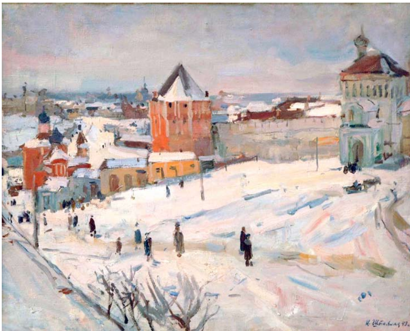
▲ Загорск зимой. 1943. Х., м. 61×80,5 см. НХМУ

картина «Музыканты на еврейской свадьбе», репродукция которой была опубликована в московском журнале «Искусство» в 1928 г. и отмечена в ряде публикаций.